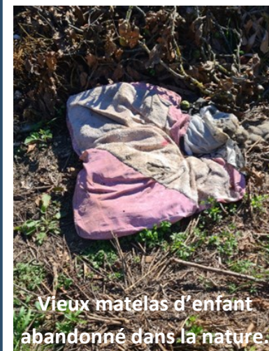
Vieux matelas d'enfant abandonné dans la nature.

1) Ces déchets, s'ils ne sont pas enlevés, vont polluer l'environnement très longtemps (un matelas, par exemple, met plus d'un siècle à se décomposer).