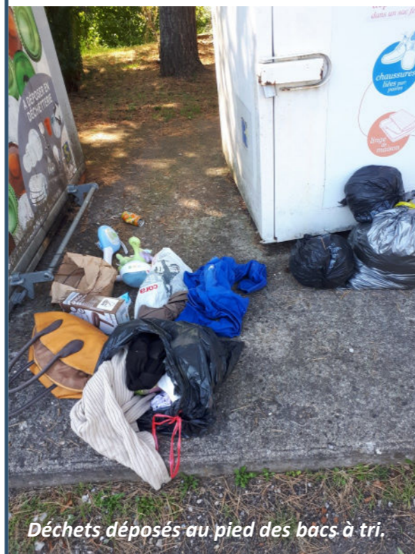
Déchets déposés au pied des bacs à tri.

Aucune tolérance ne sera accordée aux contrevenants, des plaintes seront systématiquement déposées.