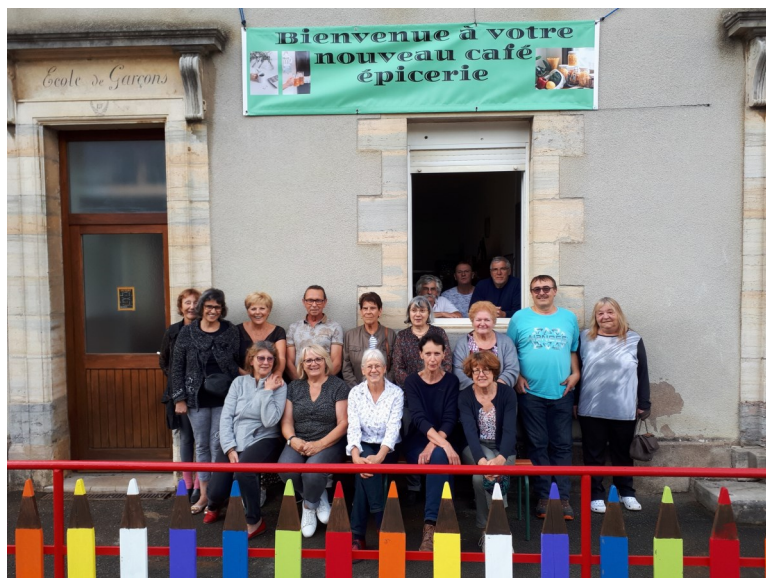
L'équipe de la nouvelle épicerie « La Ré-Création »

En effet, après une période de plusieurs mois dans les anciens vestiaires de football de la commune, l'association et de nombreux volontaires bénévoles ont restauré à leur goût, avec les « moyens du bord », l'ancienne salle de classe pour en faire un lieu ouvert au public offrant une épicerie avec le maximum de produits locaux, bio ou de simple dépannage, une salle de café avec comptoir, un coin de détente lecture, journaux, périodiques, jeux. L'aménagement d'une terrasse d'accueil est prévu, particulièrement pour accueillir les nombreux randonneurs partant de la place du village.